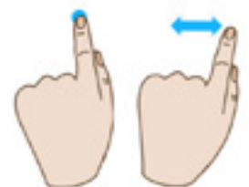
Παρατεταμένο πάτημα (και μεταφορά)