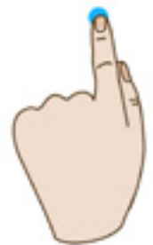
Σύντομο πάτημα της οθόνης

Αυτό είναι ένα γρήγορο άγγιγμα της οθόνης από άκρη σ'άκρη. Γίνεται προς οποιαδήποτε κατεύθυνση είναι απαραίτητο. Χρησιμοποιείται για το γύρισμα σελίδων (σε ένα βιβλίο) ή την εναλλαγή εικόνων (σε παρουσίαση φωτογραφιών).