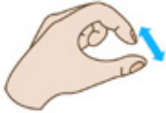
Τσίμπημα της οθόνης για μεγέθυνση